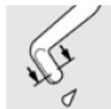
right hand G-31502