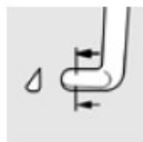
left hand G-31501